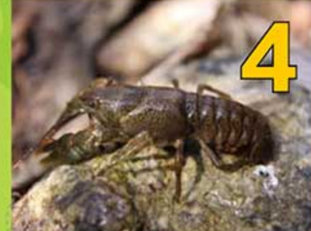
4 Rak riavový ( Austropotamobius torrentium ) – Vzácneho raka riavového, ktorého výskyt je v rámci Slovenska unikátny, môžeme nájsť aj v hornom toku Vydrice. Dosahuje dĺžku do 90 mm a o jeho vzácnosti svedčí aj zaradenie medzi druhy európskeho významu sústavy chránených území NATURA 2000, to znamená, že jeho ochrana je dôležitá z európskeho hľadiska.