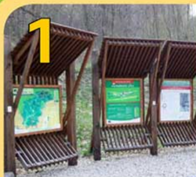
1 Náučný chodník – Pri spoznávaní okolitých drevín, histórie, technických pamiatok, ako aj zaujímavostí zo sveta živej prírody odporúčame využiť existujúce náučné chodníky (Dendrologický chodník, Červený most – Železná studienka – Kamzík).