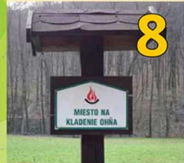
8 Ohnisko – Na obľúbené opekanie v prírode využívajte výlučne „miesta na kladenie ohňa“. Hlavnou príčinou vzniku požiaru je práve nedbanlivosť a podcenenie rizika. Dôsledkom je nielen mechanické poškodenie, ale často aj viditeľné zmeny na vegetácii či živočíchoch.