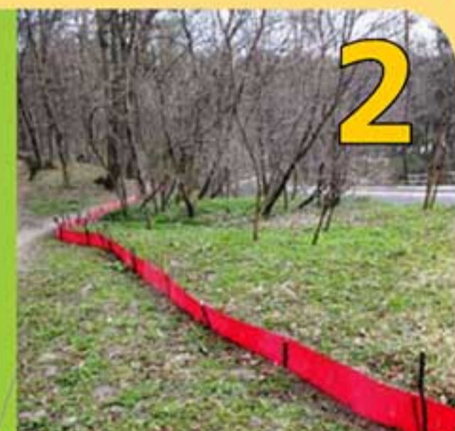
2 Jarná migrácia žiab – Počas každoročnej marcovej akcie Pomoc ropuchám pri jarných migráciách na Železnej studienke sa podarí zabrániť úhynu mnohých žiab. Pri výstavbe zábran pomáhajú viaceré inštitúcie a dobrovoľníci.