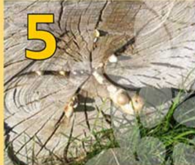
5 „Mŕtve drevo“ – Napohľad mŕtve, ale pritom plné života. Stojace či ležiace drevo v rôznom stupni rozkladu je nenahraditeľným miestom pre stovky rôznych druhov živočíchov (úkryt a zimovisko pre salamandru škvrnitú) a húb (podpŕhovka bezprsteňová). Rozklad dreva jedného stromu môže trvať 20 až 180 rokov.