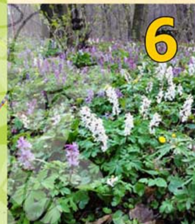
6 Jarný aspekt – Prebúdanie jari je v karpatských lesoch očarujúce. Typickým príkladom je koberec z bielych a ružovo-fialových chochlačiek.