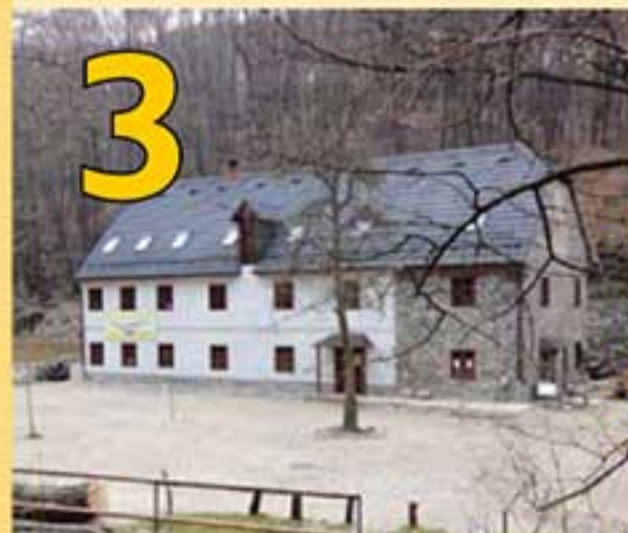
3 Mlyny – Z pôvodných deviatich mlynov sú v súčasnosti na Vydrici zachované len dva: IX. mlyn známy ako „Suchý mlyn“ a VIII. mlyn „Klepáč“. Pomenovanie Klepáč má nemecký pôvod (Clepeis) a pochádza pravdepodobne z 15. storočia. Areál mlyna dnes ponúka program najmä rodinám s deťmi a školám, ale slúži aj turistom na malé občerstvenie.