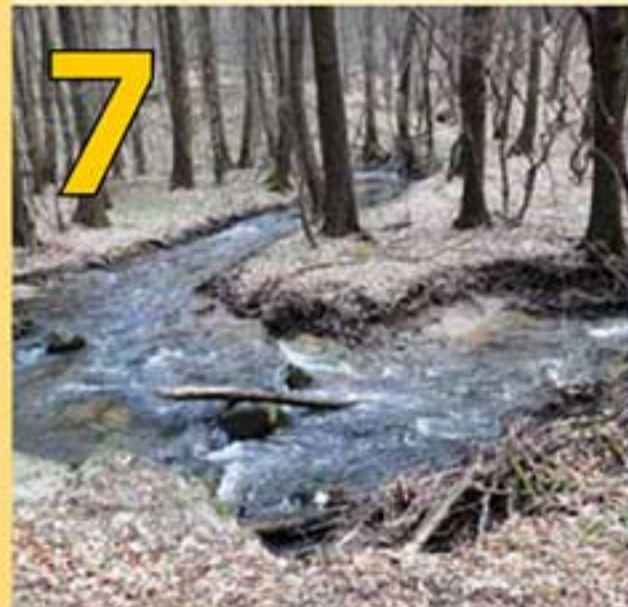
7 Meander Vydrice – Meander predstavuje odchýlku vodného toku od priameho smeru vo forme oblúka a vzniká vďaka bočnej erózii vodného toku. Pozdĺž Vydrice nájdeme niekoľko takýchto malebných miest.